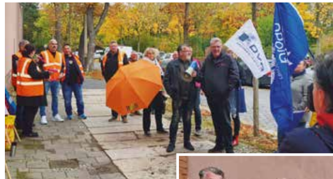
> Teilnehmer vor der JVA „Roter Ochse“ in Halle

Bei seinen Arbeitskampfmaßnahmen will der BSBD Augenmaß bewahren, denn ein flä-