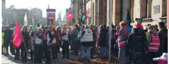
> „Wir fordern Wertschätzung für die Kolleginnen und Kollegen.“

Zu einem ganztägigen Warnstreik rief die Deutsche Justiz-Gewerkschaft (DJG) in Magdeburg und Halle am 14. November auf. Rund 300 Beschäftigte aus dem Justizbereich folgten dem Aufruf und versammelten sich vor den dortigen Justizzentren.