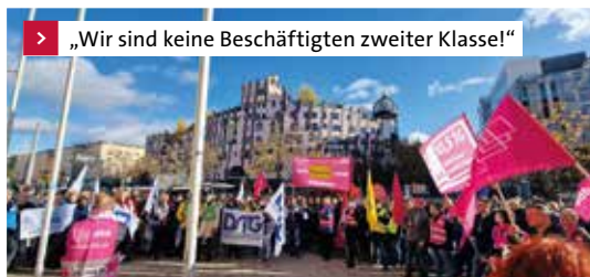
> „Wir sind keine Beschäftigten zweiter Klasse!“

„Geiz-ist-nicht-geil“ lautete das Motto, unter dem der dbb sachsen-anhalt die Beschäftigten des öffentlichen Dienstes am Folgetag, dem 16. November 2023, zu einer Mittagsdemo vor dem Justizzentrum in Magdeburg aufgerufen hat.