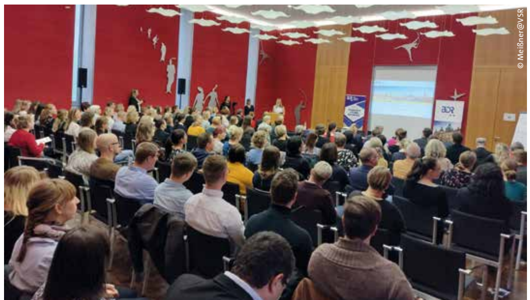
> Blick in den Saal des OLG

Tanja Romstedt betonte in ihrer Rede unter anderem, dass das Vertrauen der Bürger in den Rechtsstaat gewahrt bleiben müsse, zum Beispiel wenn es darum geht, rechtzeitig einen Erbschein oder einen Grundbucheintrag zu erhalten. Diese Aufgabe zu erfüllen beziehungsweise das Vertrauen nicht zu enttäuschen, werde jedoch bei der derzeitigen Personalsituation immer schwie-