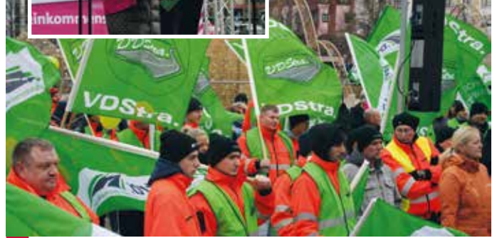
> Teilnehmerinnen und Teilnehmer an der Protestkundgebung auf dem Domplatz in Magdeburg

Landesvorsitzende des dbb sachsen-anhalt, warnte bei der Veranstaltung insbesondere vor drohenden weiteren Personalabwanderungen: „Die Länder müssen endlich von ihrer Blockadehaltung abrücken. Der öffentliche Dienst droht, auf Landesebene nicht mehr mit den Kommunen mithalten zu können und erst recht nicht mit der Privatwirtschaft.“ Der öffentli-