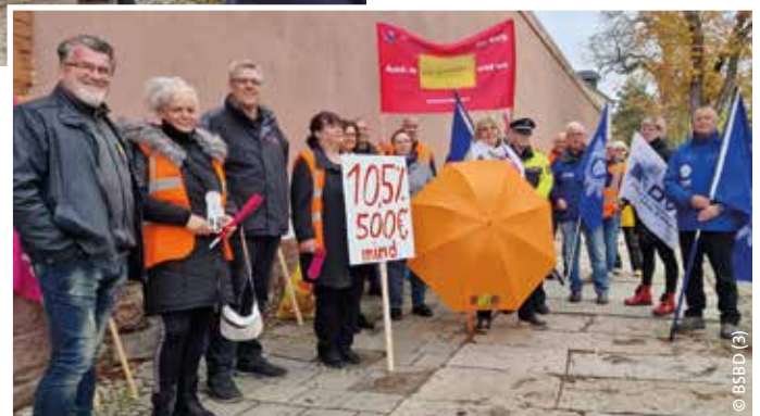
> Sicherheit muss oberste Priorität haben.

Der BSBD fordert die Arbeitgeber deshalb auf, sich endlich um die Belange des öffentlichen Dienstes und die Sicherheit unseres Landes zu kümmern und den Justizvollzug merklich zu entlasten. „Wir sitzen hier auf einem Pulverfass, dessen Lunte schon brennt. Die Politik muss bereit sein, die