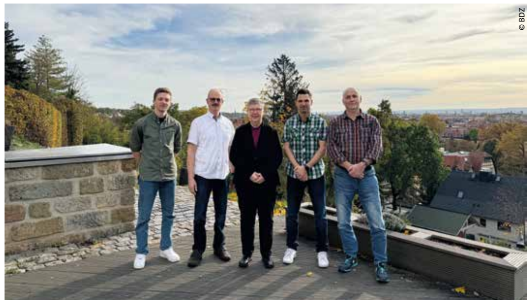
> Der neue Vorstand des BDZ

Neben der Bilanz über die vergangenen fünf Jahre und den Weichenstellungen für die nahe Zukunft standen die Wahlen zum Vorstand auf der