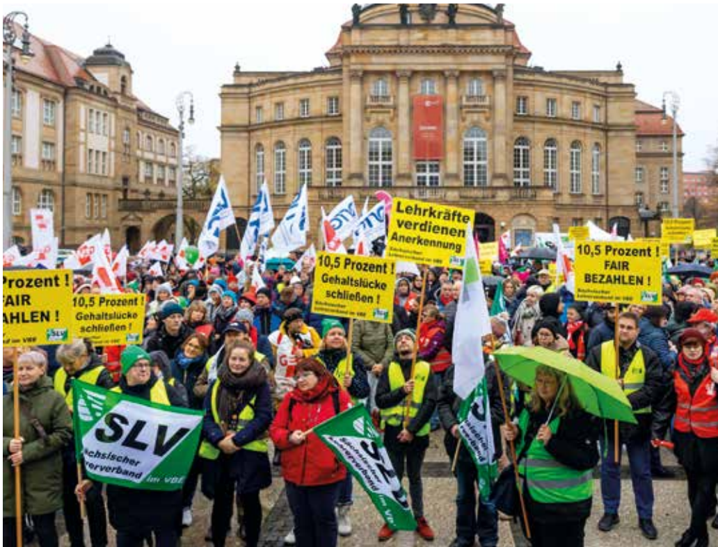
> Theaterplatz in Chemnitz mit rund 1500 Teilnehmerinnen und Teilnehmern