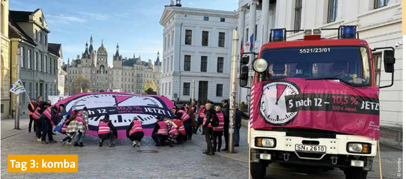
Tag 3: komba