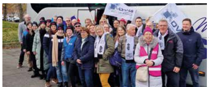
> Teilnehmer aus Sachsen-Anhalt an der Protestdemo in Erfurt am 18. November 2023

Insgesamt kamen über 500 Teilnehmer in Erfurt zusammen, um ihrer Forderung nach 10,5 Prozent, mindestens aber 500 Euro mehr im Monat, Nachdruck zu verleihen. Denn groß ist der Ärger über die Arbeitgeber, die bisher weder ein eigenes Angebot vorgelegt noch irgendein Entgegenkommen gezeigt haben.