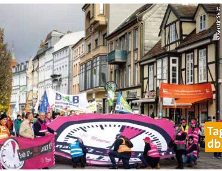
Tag 6: Finale der Aktionswoche mit dbb Landeshauptvorstand und GDL