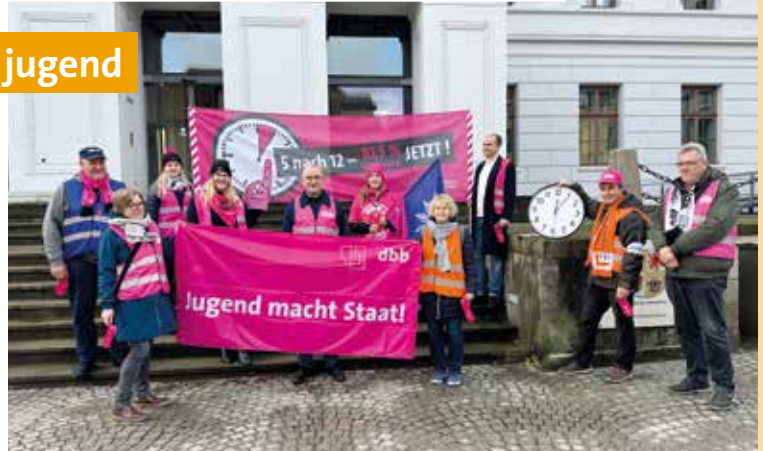
Tag 5: dbb jugend