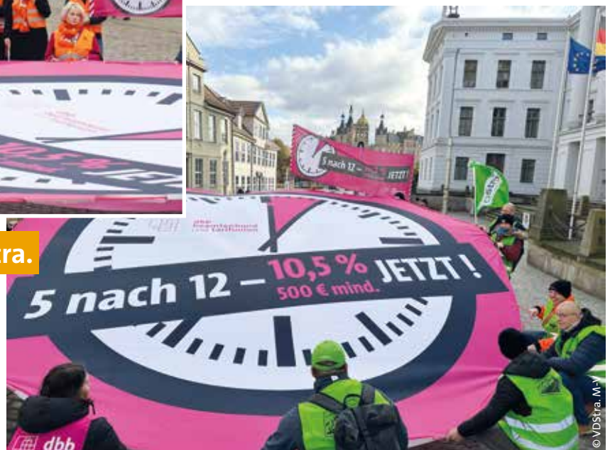
Tag 2: VDStr.