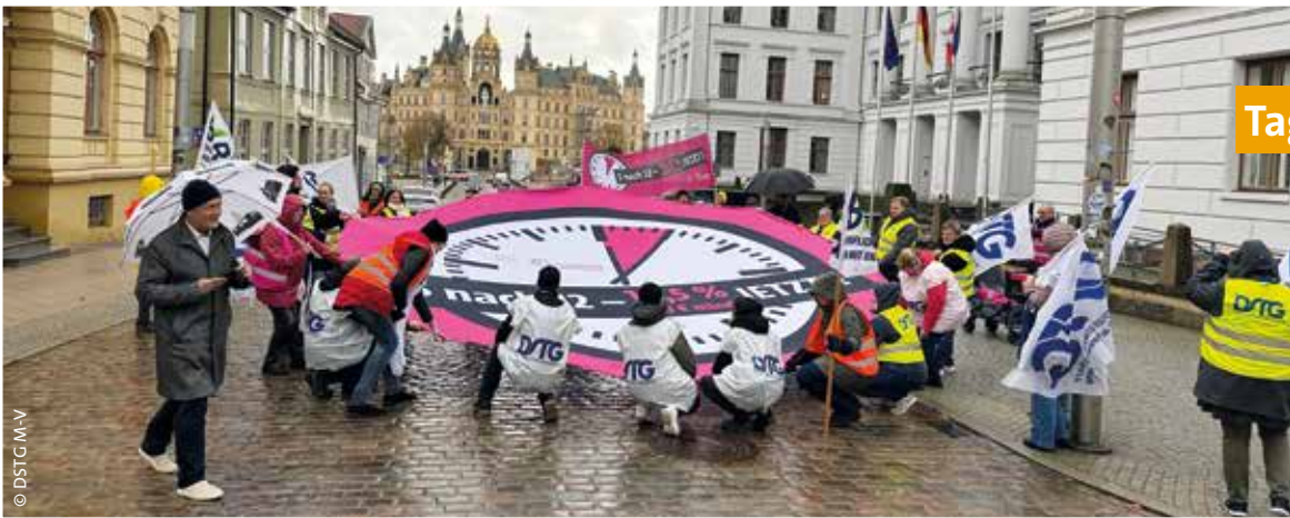
Tag 4: DSTG