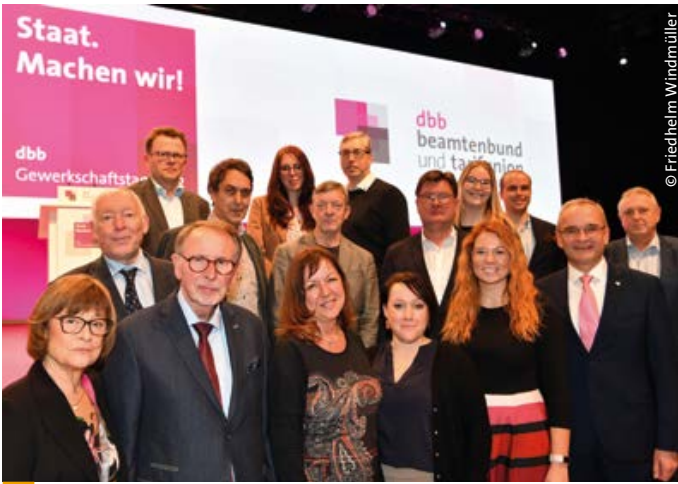
> Delegierte aus Mecklenburg-Vorpommern

Länder in den vier Rechtsbereichen Beamten-, Laufbahn-, Besoldungs- und Versorgungsrecht inzwischen immens vergrößert. Eine Reihe von Ländern habe eigene, sehr unterschiedliche Regelungen. Andere Länder wiederum wendeten in vielen Teilbereichen weiterhin die Bundesregelungen an. Die Regelungsspanne sei so groß, dass eine Vergleichbarkeit an vielen Stellen nicht mehr gegeben sei und von gleichartigen Rahmenbedingungen nicht mehr ausgegangen werden könne.