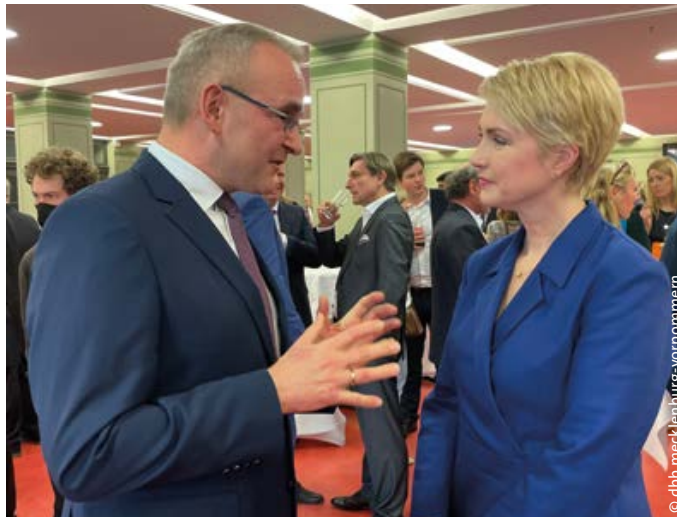
> dbb Landeschef Dietmar Knecht im Gespräch mit Ministerpräsidentin Manuela Schwesig

Ministerpräsidentin Manuela Schwesig zeigte sich überzeugt, dass trotz der Krisen 2023 durch die weiterentwickelten Aktivitäten der Landesregierung und des dbb mecklenburg-vorpommern ein wichtiges Jahr für den öffentlichen Dienst des Landes in Bezug auf Attraktivitätssteigerung und Nachwuchsgewinnung sein wird. Ein wichtiger Baustein dafür wer-