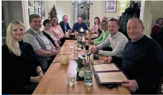
> Die Vertreterinnen und Vertreter des tbb und tlV beim Arbeitstreffen Mitte Januar 2023 in Erfurt

Dass dieser Effekt wirklich greift, wurde wegen überalterter Lehrerschaft stark bezweifelt. Dass Lehremangel, Stundenausfall und planmäßiger Unterrichtsausfall drastische Auswirkungen