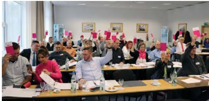
> komba Landesgewerkschaftstag Thüringen