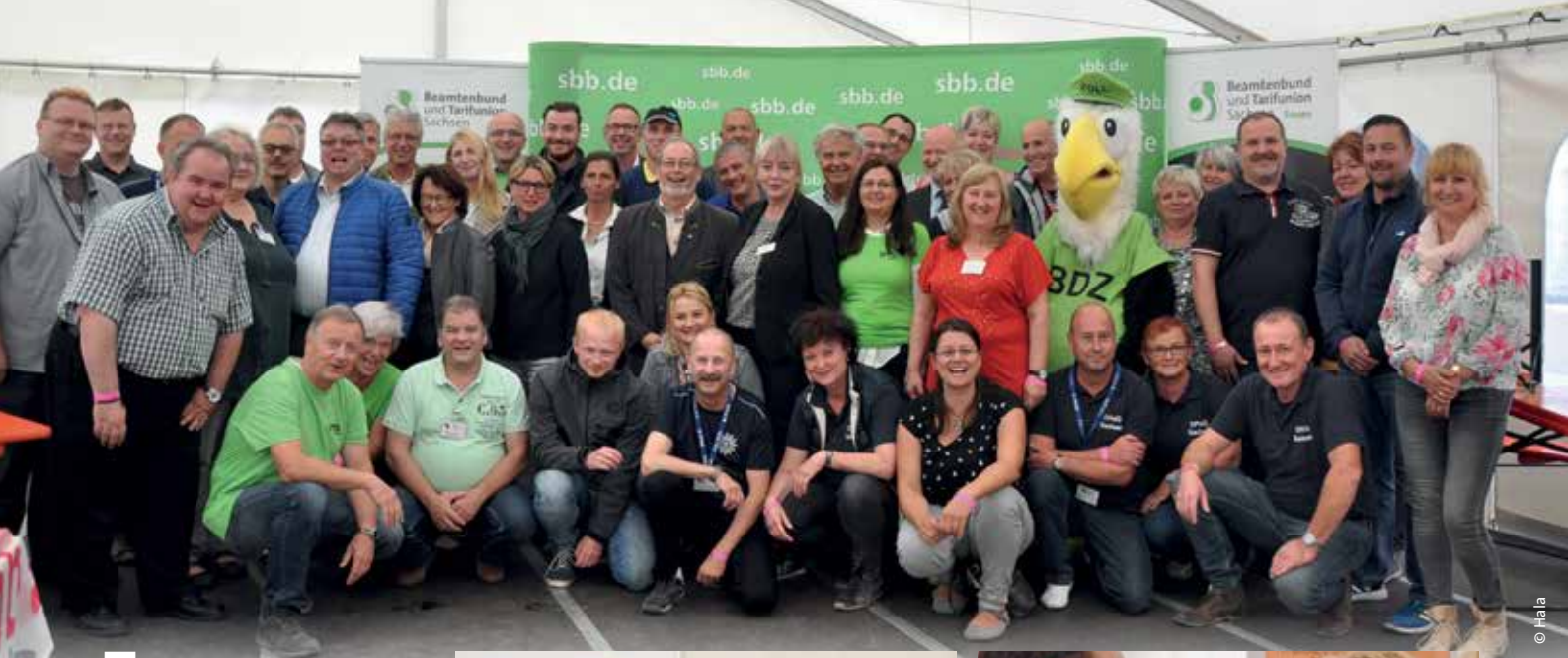
> Das Team vom Tag der Sachsen